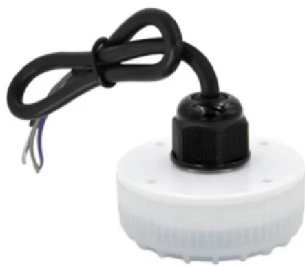
MC079D RC2 A

De MC079D-RC2-A-IP65 sensor is speciaal ontworpen voor ongewone installaties die worden gevoed met een veilige, lage spanning van 12/24V. Hij is hermetisch afgesloten tegen de binnendringing van water en stof volgens de IP65-norm, wat installatie buitenshuis mogelijk maakt. De microgolftechnologie zorgt voor detectie in een indrukwekkende straal van 15 meter, en de 0-10V-uitgang maakt een 3-traps dimstelsel mogelijk. Dankzij de mogelijkheid om functies te bedienen via een speciale afstandsbediening, hoeft de gebruiker niet naar de behuizing onder het plafond te reiken. Dit is de apparatuur die het vaakst wordt gekozen voor autonome zonne-energiesystemen en noodcircuits die in overkappingen en doorgangen worden geïnstalleerd.