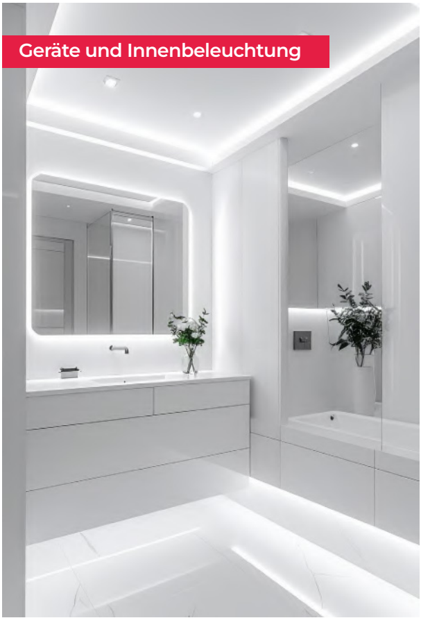
Geräte und Innenbeleuchtung