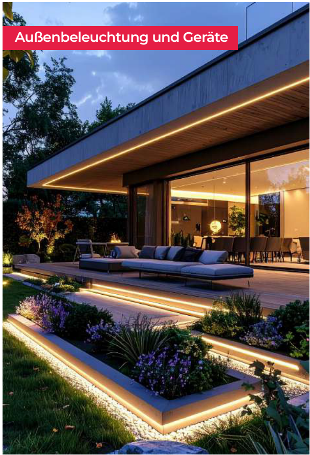
Außenbeleuchtung und Geräte

Unsere Aluminium-Netzteile erfüllen die strenge IP67-Norm, was vollständigen Schutz gegen Staub und Wasser bedeutet. Sie können bedenkenlos in feuchten und regenexponierten Umgebungen installiert werden – sowohl draußen als auch drinnen.